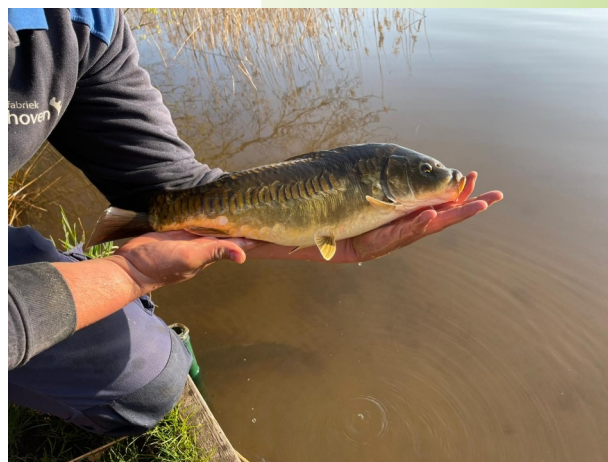
Bovenstaand enkele foto's van de onlangs uitgezette vissen.