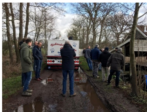
Veel bekijks bij de uitzetting van de zalmforellen