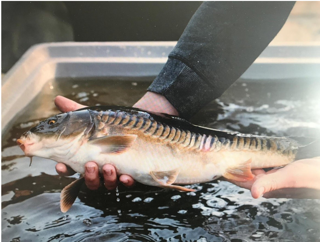
Een uitgezette rijenkarper

23 februari jl. hebben we in samenwerking met onze leverancier Carpfarm 120 kg Franse karper in de plassen uitgezet. Het betrof vissen van rond de 3-4 kg wat resulteerde in 35 stuks voor de noordplas en 10 stuks voor de zuidplas. De levering bestond o.a. uit vissen die we apart hebben laten selecteren op hun schubbenpatroon. Men moet hierbij denken aan o.a. rijenkarper van exceptionele schoonheid waar menig visser maar al te graag mee op de foto zou willen.