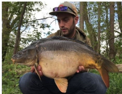
Wel gezelligheid en mooie vissen in het voorjaar