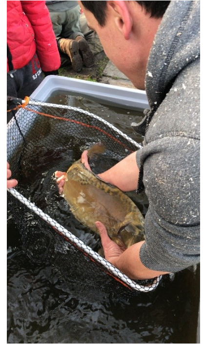
Registreren van uitgezette vissen