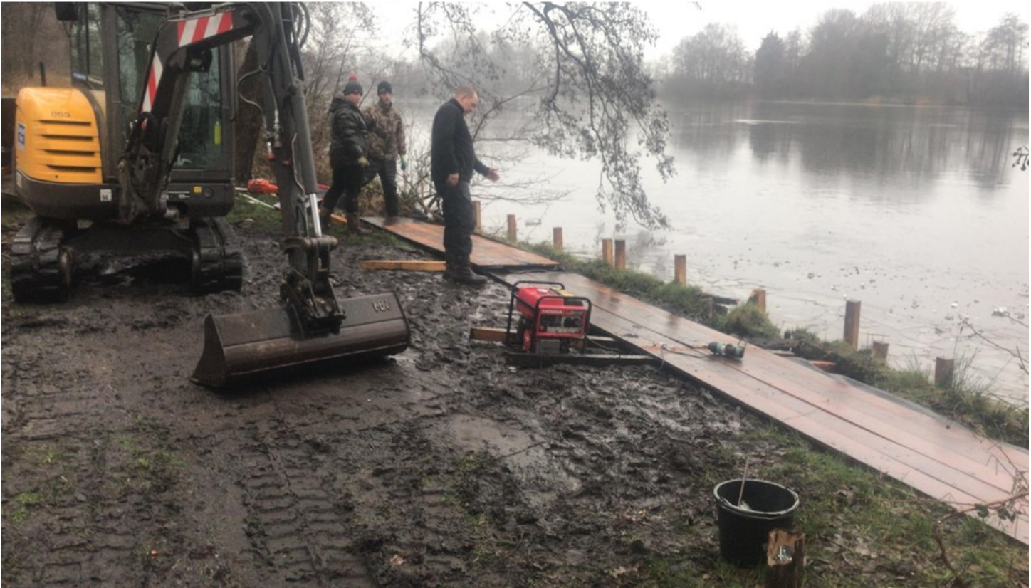
Noordplas: Het plaatsen van de beschoeiing en verwijderen van een omgevallen boom