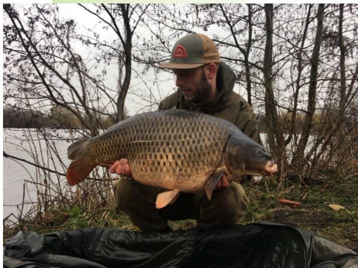
1 van de 15 kg's uit het vroege voorjaar

Lekker buiten zijn, veel vissen willen vangen, de dikste vissen willen vangen, 1 speciale target “bejagen”, de spanning willen ervaren, genieten van de natuur en omgeving, zomaar enkele argumenten om te gaan vissen. Vaak is één of meerdere van bovenstaande argumenten/ doelen aanwezig en genoeg om eropuit te trekken. Echter soms is de motivatie ver te zoeken en in 2018 was dit bij mij om onduidelijke reden het geval.