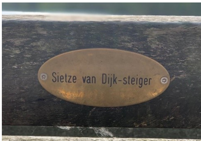
Naambordje op steiger

Daarnaast was de heer Sietze van Dijk vorig jaar 60-jaar lid van onze vereniging. Om dit heugelijke feit te vieren hebben wij de invalidesteiger aan de Oostwal van de noordplas gedoopt tot de Sietze van Dijk – steiger en is hierop is door alle aanwezigen met het glas in de hand geproost. In het januarinumnummer van Haren de Krant verscheen vervolgens een mooi stukje over het speldje dat de heer Van Dijk op 13 januari 2019 van het bestuur kreeg overhandigd (het artikel is verderop te lezen). Ook hebben we nog een eerder afgenomen interview achterhaald en in ook in deze nieuwsbrief opgenomen.