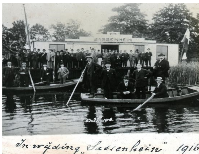
Opening van paviljoen in 1916