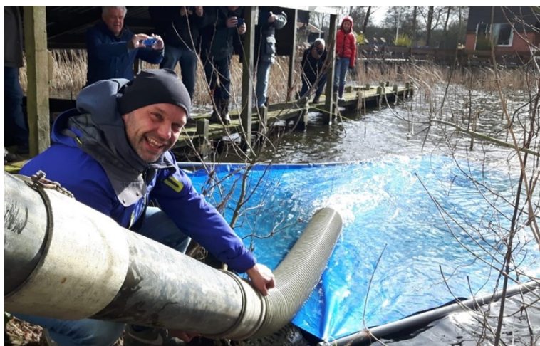
De zalmforellen gaan via een glijbaan ter water