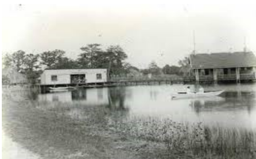
Paviljoen en pachterswoning 1930